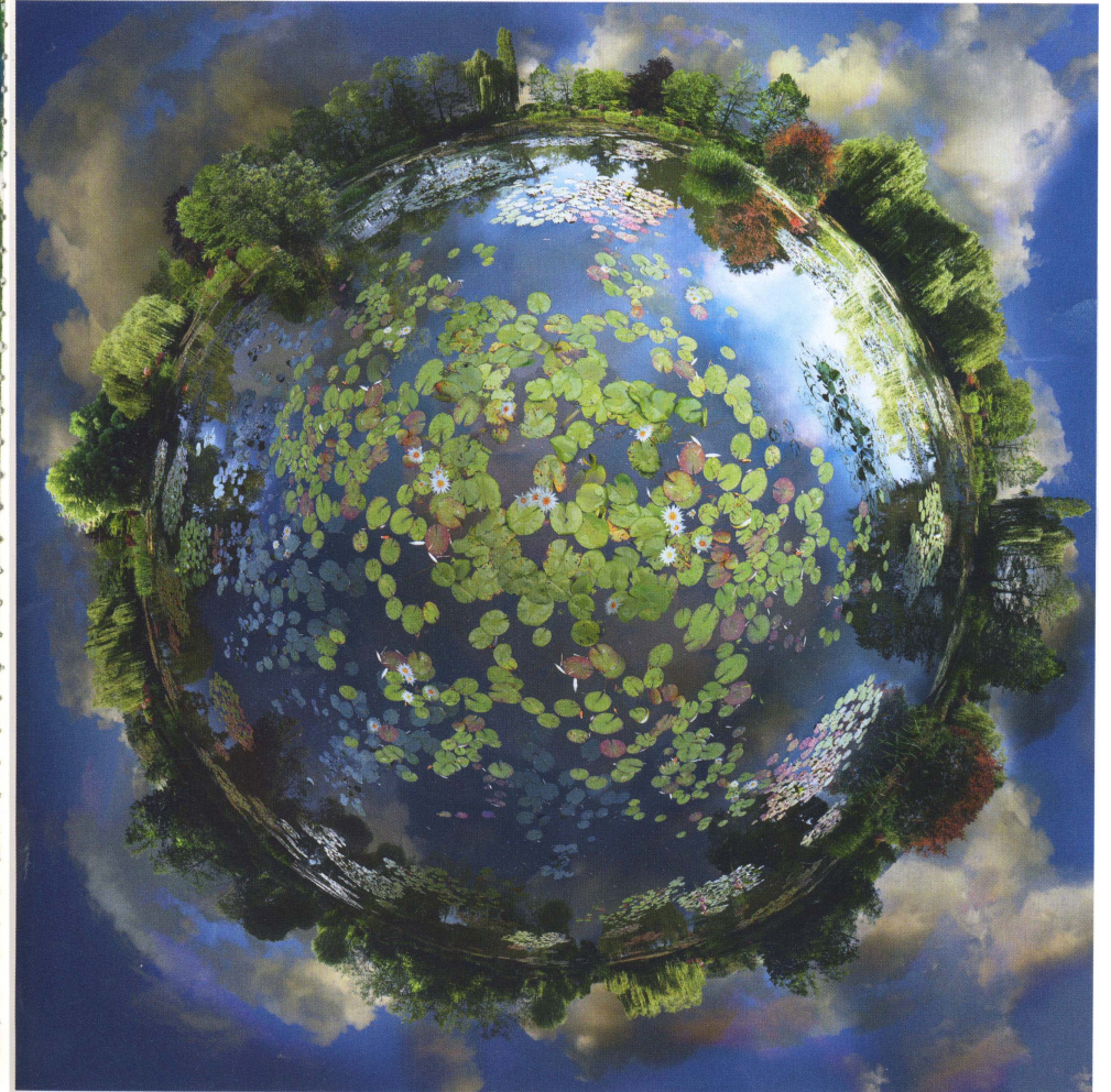
Nymphéas par Catherine Nelson , artiste australienne et Belge d'adoption, née en 1970. Créatrice d'effets spéciaux pour le cinéma.

CRÉATION 14, MONET'S GARDEN, 2010, 150 x 150 cm, GALERIE PARIS-BEIJING, PARIS.