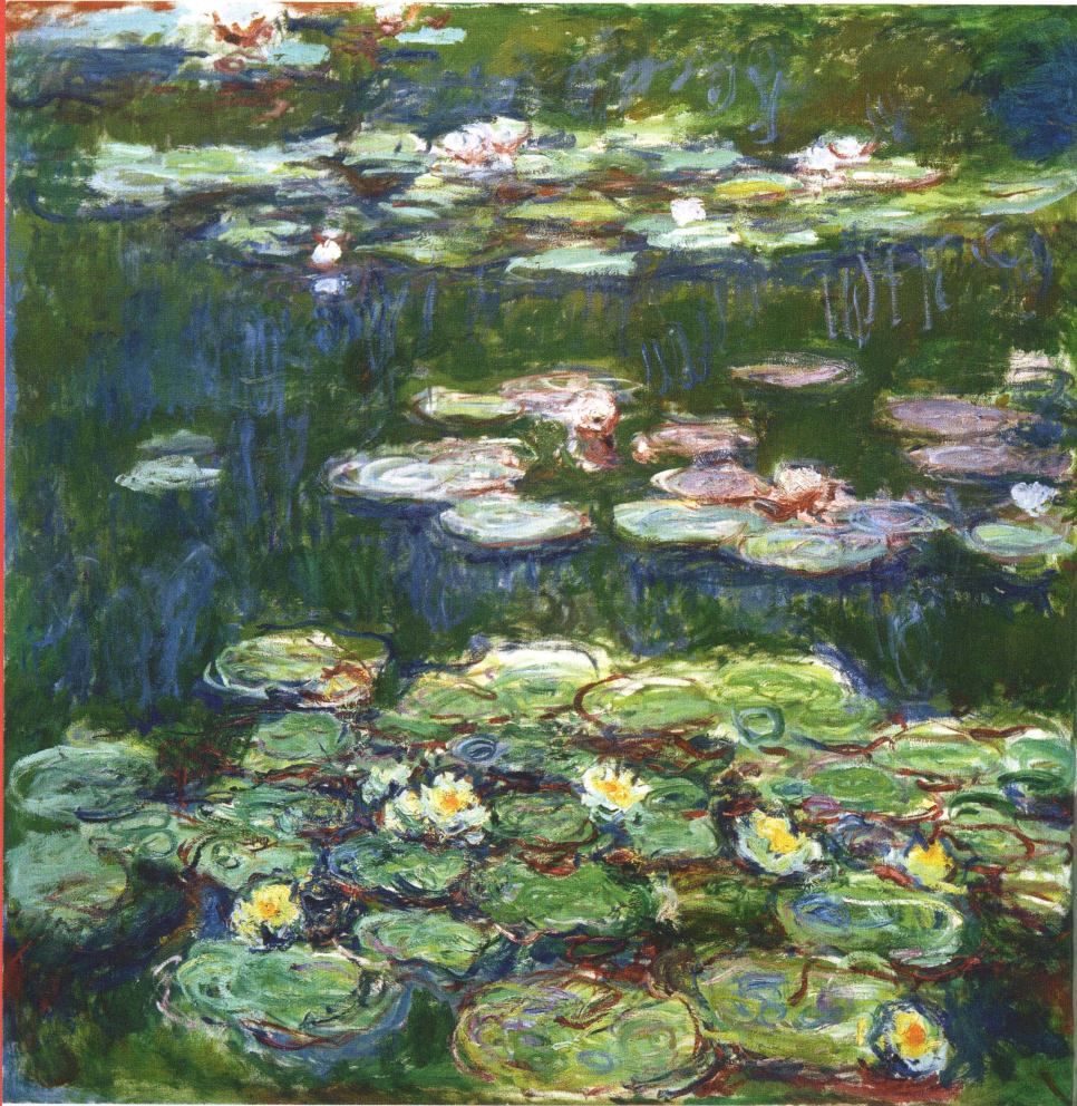
Nymphéas par Claude Monet (1840-1926), père de l'impressionnisme et amateur de nénuphar. NYPHÉAS BLANCS ET JAUNES, 1916, HUILE SUR TOILE, 200 x 200 cm, MUSÉE D'ART, WINTERTHUR.