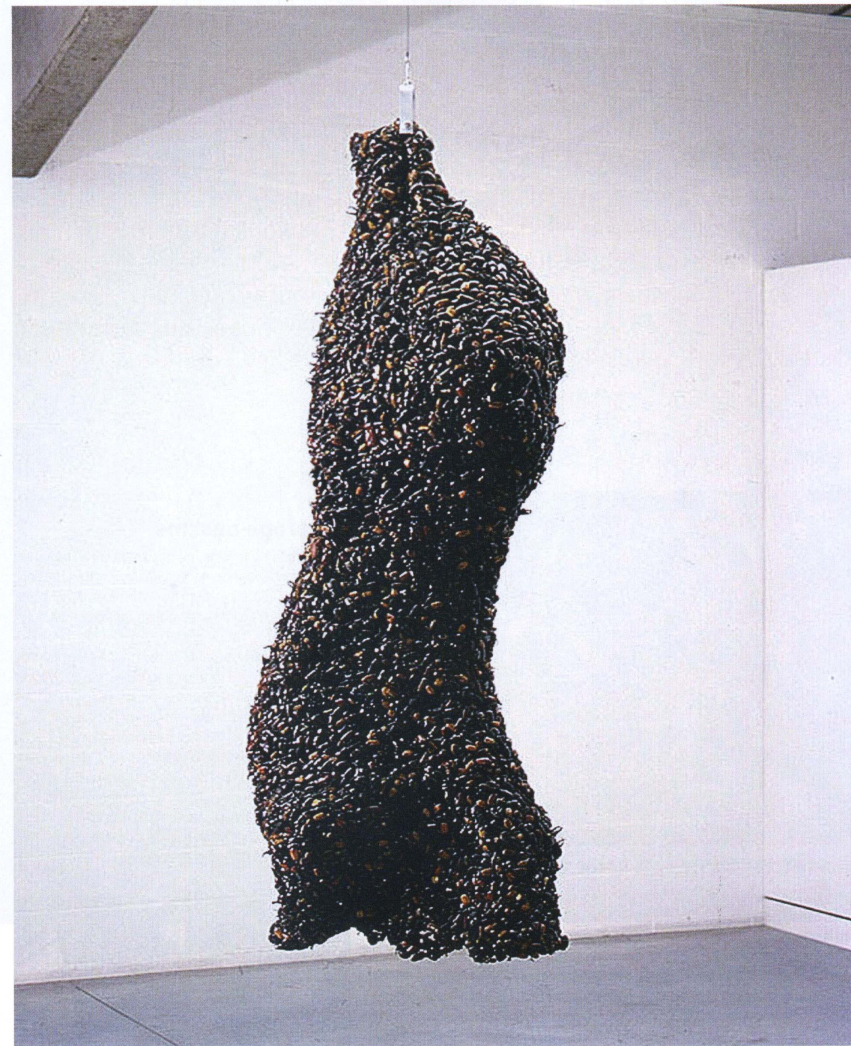
Pièce de boucherie par Jan Fabre , dessinateur, sculpteur, chorégraphe belge de 53 ans, grand consommateur de scarabées. VLEESKLOMP (LUMP OF MEAT), 1997, 142 x 142. G 1997, SCARABÉES-BIJOUX SUR FIL, 200 x 65 x 30 cm, DEWEER GALLERY, OTEGEM.